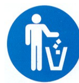
versare i rifiuti nei contenitori appositi