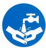
lavarsi le mani