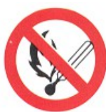
vietato fumare e/o usare fiamme libere