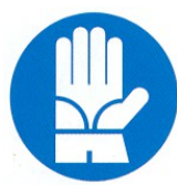
guanti di protezione