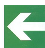
freccia di direzione