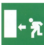
direzione uscita d'emergenza