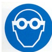
proteggere gli occhi