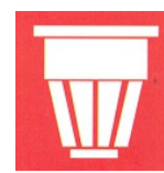
rivelatore di fumo