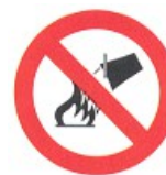
divieto di spegnere con acqua